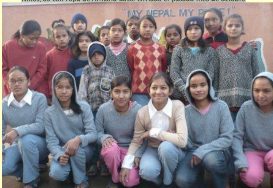
Niños/as con ropa de Armand Bassi enviada el pasado mes de octubre

Como en la anterior versión se accederá con la password correspondiente, a través del apartado SOCIOS de la página WEB de NEPAL-AKI. Siguiendo unas pautas sencillas el programa permite la emisión en automático del informe en castellano y en inglés. Se ha intentado mejorar ampliado las opciones disponibles y hemos hecho especial hincapié en la redacción del informe en inglés. Otra novedad es que con el informe irá acompañado de una carta personalizada dirigida al responsable del orfanato, la cual se pedirá que sea firmada como acuse de recibo. Esperamos tener una buena acogida y que apreciéis los esfuerzos que se han realizado. Queremos dar un agradecimiento especial a Susan Hursey que ha dedicado mucho tiempo a este proyecto.