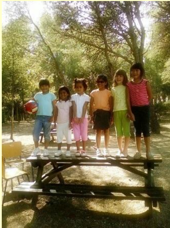
Algunas participantes del encuentro del 3 y 4 de octubre